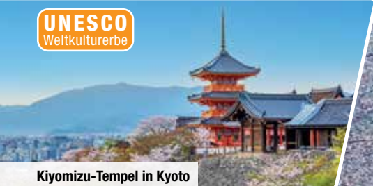
Kiyomizu-Tempel in Kyoto