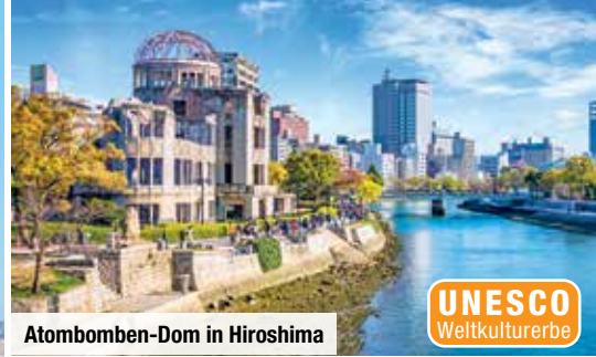
Atombomben-Dom in Hiroshima