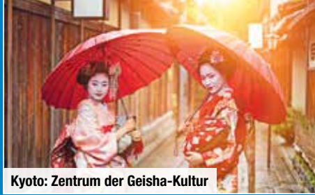
Kyoto: Zentrum der Geisha-Kultur