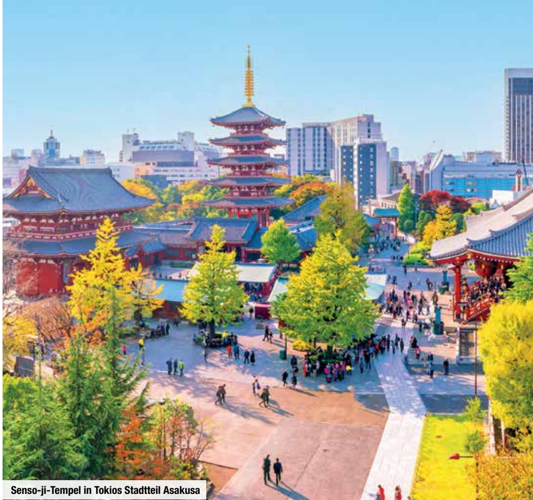
Senso-ji-Tempel in Tokios Stadtteil Asakusa