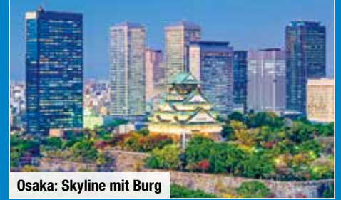
Osaka: Skyline mit Burg