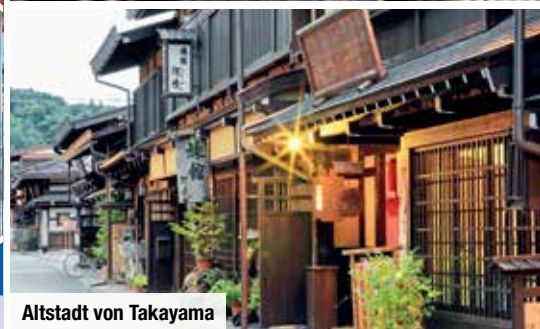
Altstadt von Takayama