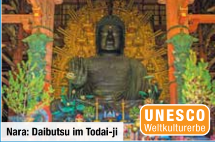
Nara: Daibutsu im Todai-ji